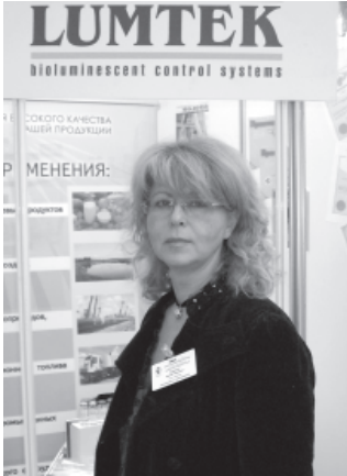
Сюжет с 6-го международного форума Мясная Индустрия 30.01.07.

Лаборатория "Элин" представила уникальную технологию контроля качества продуктов питания. В основе этой технологии – IBDL – семейство миниатюрных бытовых самописцев. Приборы размером с "домофонную таблетку" способны регистрировать окружающие температуру и влажность в режиме реального времени. То есть, владелец такого прибора знает не просто цифру температуры и влажности на тот или иной момент, а имеет перед собой историю этих параметров за определенный отрезок времени. Как показала практика, такая история позволяет контролировать (в том числе конспиративно) транспортировку продукции сторонним транспортом, мониторить условия хранения продуктов на складе, выявлять хищения из изотермических контейнеров и др.